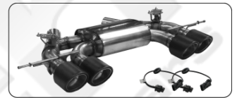
Quattro Carbon S Ø 110 mm, 25° schräg für Serien Abgasklappen pour clapets d'échappement de série for serial exhaust flaps para válvulas de escapes de serie