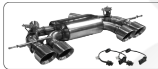
Quattro RACE S Ø 110 mm, 25° schräg für Serien Abgasklappen pour clapets d'échappement de série for serial exhaust flaps para válvulas de escapes de serie